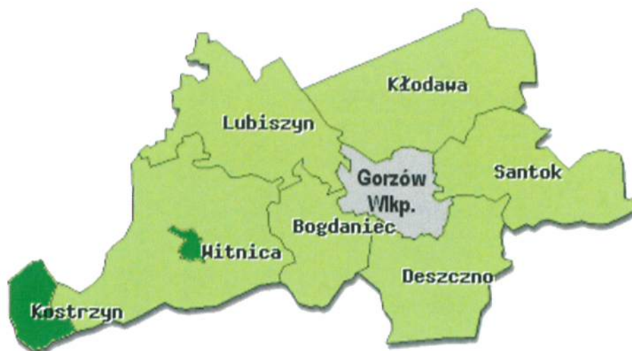
fig.1 Miasta i Gminy Powiatu Gorzowskiego

Właściwość miejscowa inspektoratu obejmuje teren administracyjny Powiatu Gorzowskiego, bez miasta Gorzowa Wlkp., obejmujący miasto Kostrzyn nad Odrą, miasto i gminę Witnica oraz gminy Bogdaniec, Deszczno, Kłodawa, Lubiszyn i Santok.